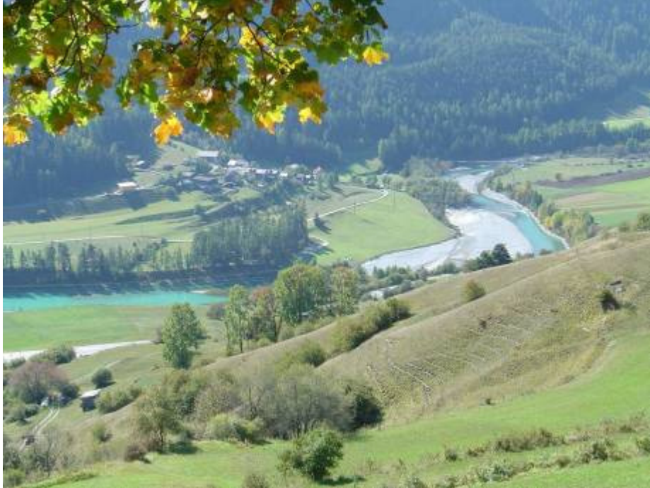
Blick hinüber nach Pradella

Der richtige Weg für einen Spaziergang: Eigentlich fast nur bergab, mit Sicht übers Tal - und auch aufwärts machbar.